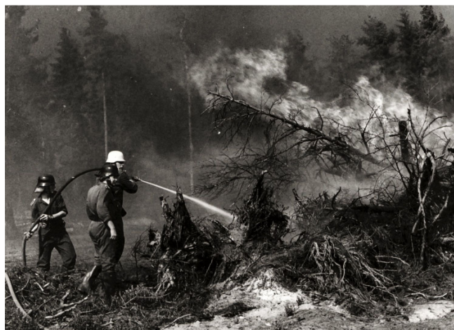
Drei Feuerwehrmänner beim Löschen mit einem C-Rohr im Waldgebiet der Gemeinde Sassenburg (Landkreis Gifhorn).

Naturkatastrophen wie Orkane, Tornados, Schneestürme, Überschwemmungen, Waldbrände, Vulkanausbrüche, Erdbeben und Erdbeben mit ihren vielfältigen Ursachen gehören sicherlich zu den größten Tragödien der Menschheitsgeschichte. In seiner diesjährigen großen Sonderausstellung präsentiert das Feuerwehrmuseum Schleswig-Holstein in Norderstedt Fotos von den drei größten Naturkatastrophen der letzten 50 Jahre in Norddeutschland: die Flutkatastrophe von 1962 in Hamburg, die Waldbrandkatastrophe von 1975 in Niedersachsen und die Se