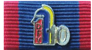
Das neue DFV-Dienstzeitabzeichen ist in Schleswig-Holstein nicht zulässig.

Der DFV hat ein Dienstzeitabzeichen mit dem „DFV-Helm“ und Jahreszahl als Bandschnalle herausgebracht, das für die Feuerwehr-Dienstzeit getragen werden kann, soweit in den Bundesländern keine eigenen Dienstzeitabzeichen vorhanden sind. Für dieses Abzeichen gibt es vom DFV keine Regularien. Es wird den Landesfeuerwehrverbänden überlassen, wie sie mit der Trageerlaubnis dieser Abzeichen umgehen.