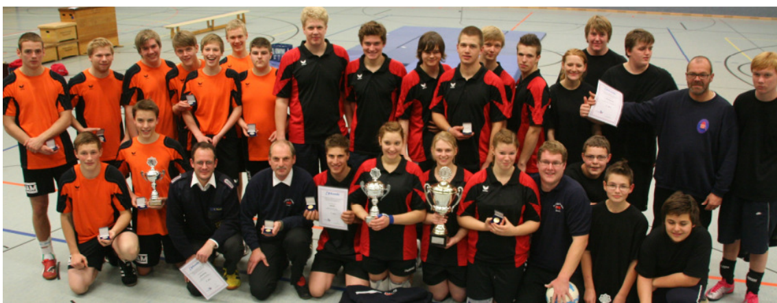
Die ersten drei Sieger des 14. Landes-Volleyballturniers: JF Weede (Mitte), JF Fahrenkrug (links) und die JF Neuenbrook.

Die Platzierungen: 1. JF Weede (SE), 2. JF Fahrenkrug (SE), 3. JF Neuenbrook (IZ), 4. JF Fleckeby (Rd-Eck), 5. Hüttener Berge (RD-ECK), 6. Barsbüttel (OD), 7. Bönningstedt (PI), 8. Kaltenkirchen (SE), 9. Klausdorf (PLÖ), 10. Honigsee (PLÖ). (bau).