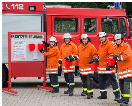
Drei „Ersatz-Feuerwachen“ haben die Fahrdorfer bei der Bundestagswahl vor den Wahllokalen aufgestellt.

... dass die Bürger sich für die FF interessieren lassen und überrascht sind, was da eigentlich so hinter steckt.