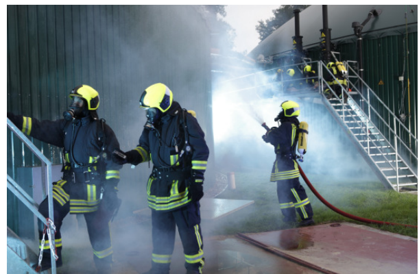
Mit diesem Foto hat es die FF Aukrug-Böken in die Endrunde des Dräger-Fotowettbewerbs geschafft und wirbt nun um viele Online-Stimmen.