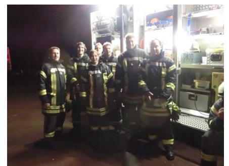
Die Kameraden der FF Appen wurden von Nachbarwehren und der Bundeswehr bei der Durchführung der Großveranstaltung tatkräftig unterstützt.

Albig dankte den vielen Organisatoren und Helfern von „Appen musiziert“ für dieses einmalige ehrenamtliche Projekt der Superlative: „Eine so große Hilfsbereit-