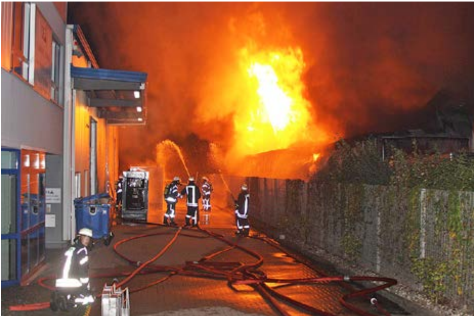
Ein Sarglager brannte in Braak bis auf die Grundmauern nieder.

Ein Großfeuer hat am Dienstag im Gewerbegebiet Stapelfeld/Braak (Stormarn) eine Lagerhalle vollständig zerstört. Gegen 03.10 Uhr hatte ein LKW-Fahrer Feuerschein bemerkt und die Polizei alarmiert. Als wenig später die Wehren Stapelfeld und Braak am Einsatzort eintrafen, stand das Gebäude eines Handelsunternehmens für Särge und Bestattungsbedarf bereits im Vollbrand.