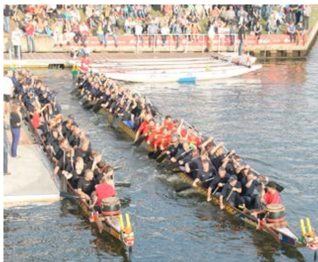
100 Mann in zwei Booten auf dem Weg zum Start

Eine Ortswehr paddelte dabei um den Einzug ins Finale und eine Spende für die Kasse der örtlichen Wehr. Jeweils die fünf schnellsten Wehren durften dann im Finale in extra