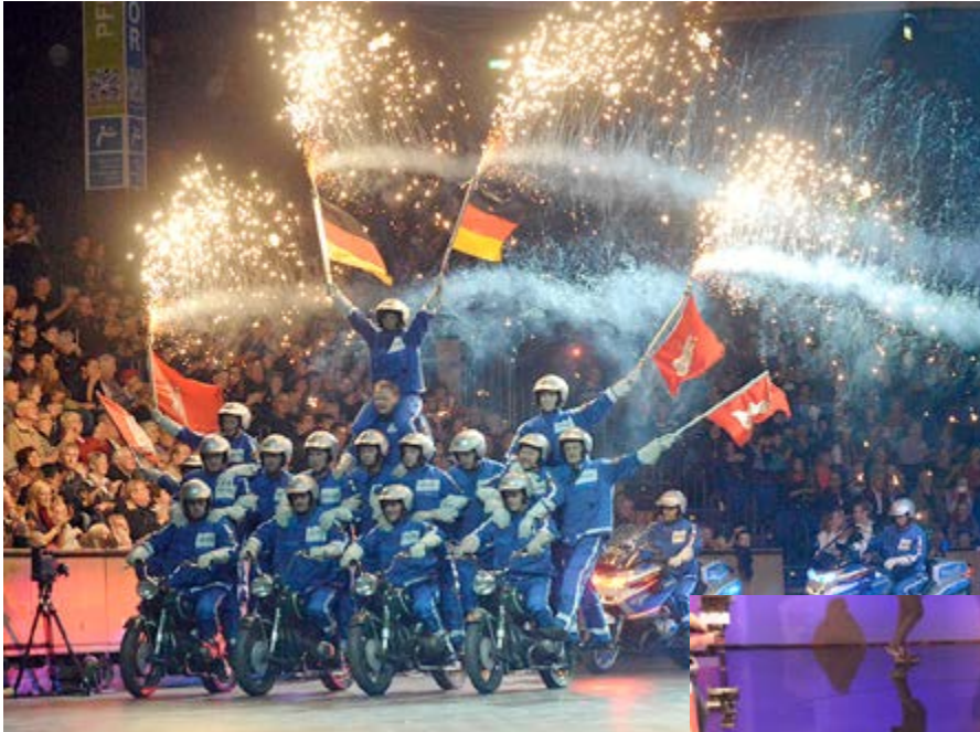
Die Kradstaffel gehört seit Jahren zum festen Programm der Polizeishow