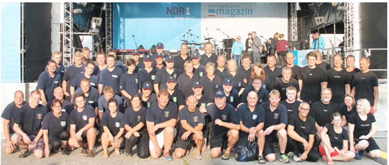
Die Siegermannschaften des 1. Feuerdrachen-Cups