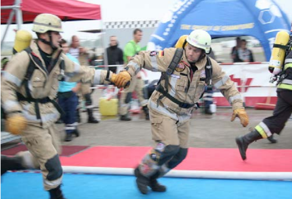
Sportliche Herausforderungen gab es bei der Fire Fighter Combat Challenge in Berlin

18 Freiwillige Feuerwehrleute aus Schleswig-Holstein brachen zu einem zweitägigen Ausflug der besonderen Art nach Berlin auf. Ziel war die „8. Berlin Firefighter Combat Challenge“. Dieser Feuerwehrwettkampf, der dem Teilnehmer alles an Reserven abverlangt, wurde auf dem „Tempelhofer Feld“, der Start- und Landebahn des ehemaligen Flughafens Berlin-Tempelhof ausgetragen.