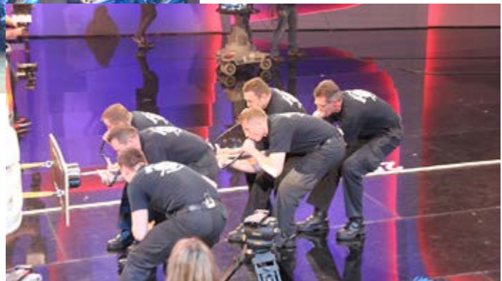
Bei Wetten dass haben sie verloren. In Kiel bekommt die Feuerwehr Hamburg eine Revanche

Auch im diesem Jahr wird die Polizeishow vom Landesfeuerwehrverband Schleswig-Holstein unterstützt. Neben einer Einsatzübung „Unfall“ der Freiwilligen Feuerwehr Büdelsdorf wird es noch eine ganz außergewöhnliche Aktion der Berufsfeuerwehr Hamburg geben: Bei „Wetten, dass...“ sind sie nur knapp gescheitert. In Kiel wollen sie nun beweisen, dass es doch zu schaffen ist! Das sechsköpfige Team wird sich mit Hilfe eines Rohrsystems mit Topf und Gummilippe an einem Löschfahrzeug festsaugen und dieses Löschfahrzeug dann 30m durch die Halle ziehen! Der Unterdruck entsteht allein durch das Ansaugen mit dem Mund. Das Ziehen erfolgt dann mit Muskelkraft an dem Rohrsystem. Wir drücken die Daumen!