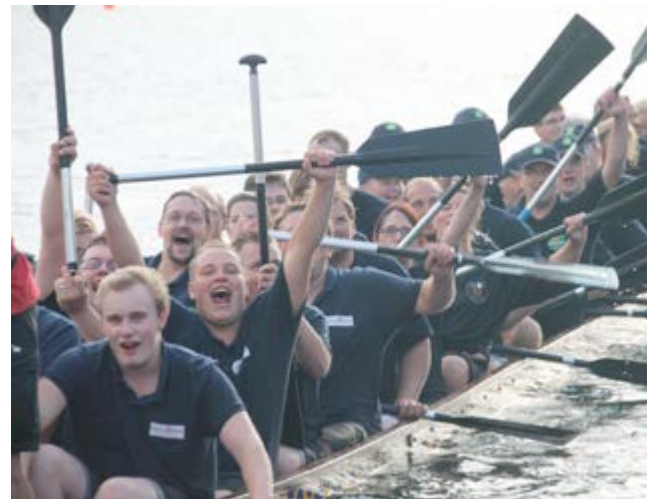
So sehen Sieger aus.

Mit neuer Motivation konnte das andere Boot kurz vor der Ziellinie vorbeiziehen und sich so den Sieg sichern. Ein spannendes Kopf-an-Kopf-Rennen also. Boot 2 siegte mit einer Zeit von 1:58,75 Minuten vor Boot 1 mit 1:59,61 Minuten. Auf der NDR-Bühne wurden die Sieger vom NDR-Moderatorenteam Maik Jäger und Sebastian Franke und LFV-Öffentlichkeitsreferent Holger Bauer gefeiert. Der Wettbewerb habe riesigen Spaß gemacht, waren sich alle Paddler einig und versprachen nächstes Jahr wieder an den Start zu gehen. Kleine organisatorische Pannen des Veranstalters wurden bereits angesprochen und dürften im nächsten Jahr nicht mehr auftreten. Mit der Wettbewerbsausschreibung kann dann auch wesentlich früher als in diesem Jahr gerechnet werden. (bau).