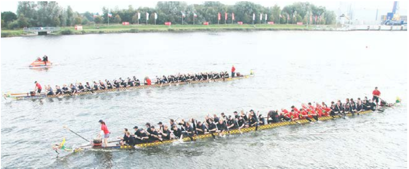
Mit einer Nasenlänge hatte Boot 2 am Ende den Vorteil

Mit neuer Motivation konnte das andere Boot kurz vor der Ziellinie vorbeiziehen und sich so den Sieg sichern. Ein spannendes Kopf-an-Kopf-Rennen also. Boot 2 siegte mit einer Zeit von 1:58,75 Minuten vor Boot 1 mit 1:59,61 Minuten. Auf der NDR-Bühne wurden die Sieger vom NDR-Moderatorenteam Maik Jäger und Sebastian Franke und LFV-Öffentlichkeitsreferent Holger Bauer gefeiert. Der Wettbewerb habe riesigen Spaß gemacht, waren sich alle Paddler einig und versprachen nächstes Jahr wieder an den Start zu gehen. Kleine organisatorische Pannen des Veranstalters wurden bereits angesprochen und dürften im nächsten Jahr nicht mehr auftreten. Mit der Wettbewerbsausschreibung kann dann auch wesentlich früher als in diesem Jahr gerechnet werden. (bau).