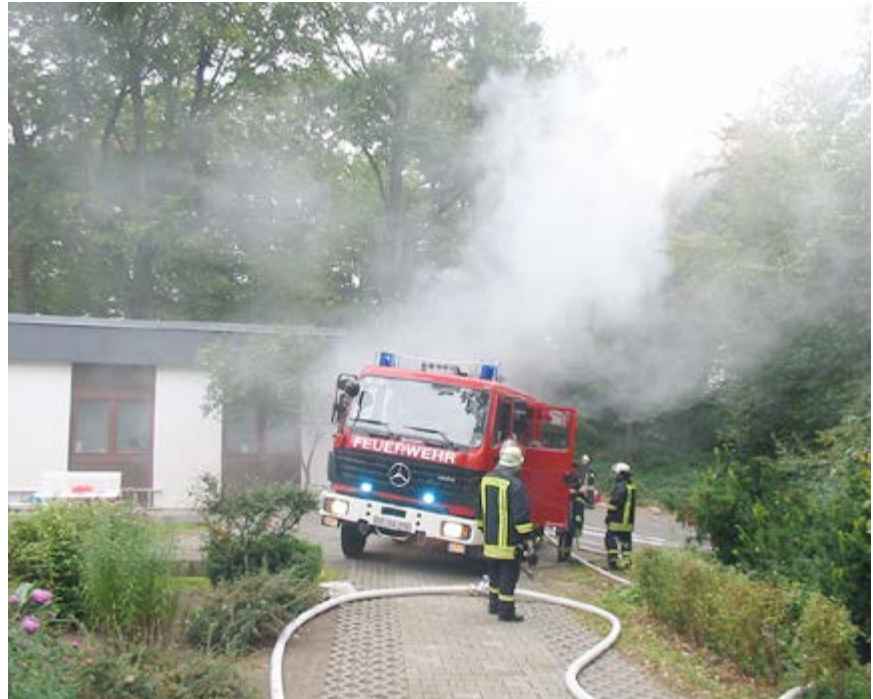
Text / Foto: Thomas Grimm Feuerwehr und DRK übten gemeinsam in einem Seniorenheim in Alt Mölln

Abgesehen von dem Spaß, den alle Beteiligten dabei hatten, sind solche Übungen für Einsatzkräfte immens wichtig um auch auf schwierige Einsatzlagen richtig reagieren zu können.