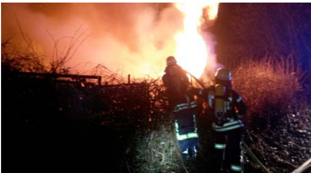
Eine Gartenlaube brannte in Bad Segeberg

Am 20.2. gegen 18:30 Uhr meldete ein Anrufer aus dem Kastanienweg in Bad Segeberg dass eine Gartenlaube in der Kolonie Seeblick brennen würde. Die Leitstelle Holstein löste Alarm für die FF Bad Segeberg aus und informierte die Polizei.