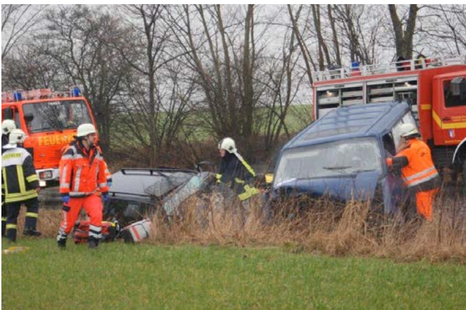
Bei diesem schweren VU kamen zwei Aktive der FF Hutzfeldt ums Leben.

Auf der L176 zwischen Hassendorfer Kreuz und Hutzfeld kam es am vergangenen Freitag zum Frontalzusammenstoß zwischen einem Kleinbus und einem VW-Golf. Dabei wurden alle drei Insassen in beiden Fahrzeugen eingeklemmt und mussten von der Feuerwehr aus ihren Fahrzeugen befreit werden.