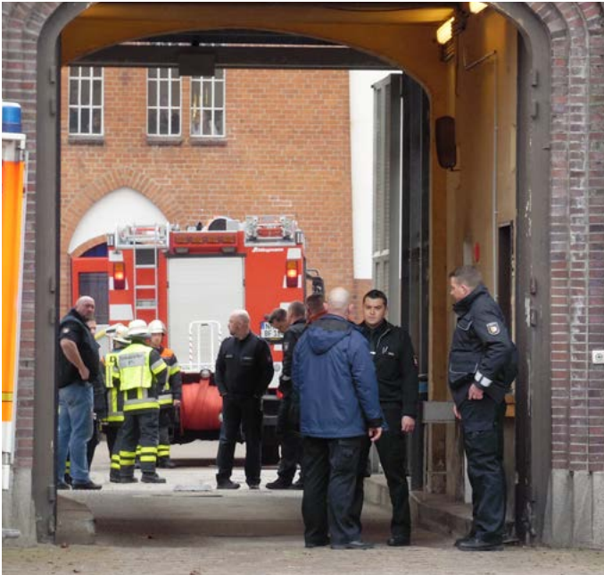
Bei einem Brand in der JVA Neumünster wurden 21 Menschen verletzt

Nachdem ein 24jähriger Gefangener am Dienstagmittag Matratze und Gegenstände in seiner Zelle in der JVA Neumünster angezündet hatte, kam es zu einem Großeinsatz der Feuerwehr.