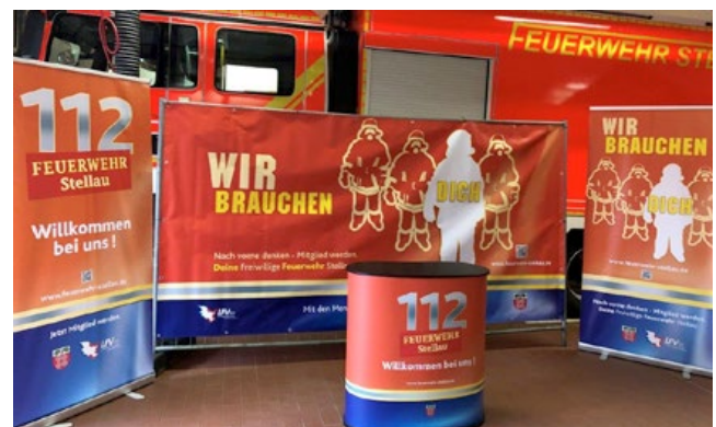
Die FF Stellau freut sich über ihr neues Werbematerial.

Die Bauzaunplane „Wir brauchen Dich“ schmückt auch schon während der Baumaßnahme am Gerätehaus die Baustellenabsicherung und macht auf das Thema aufmerksam.