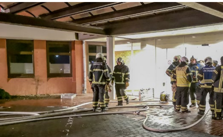
Einen Brand im Keller der Ameos-Klinik hatte die FF Neustadt schnell im Griff