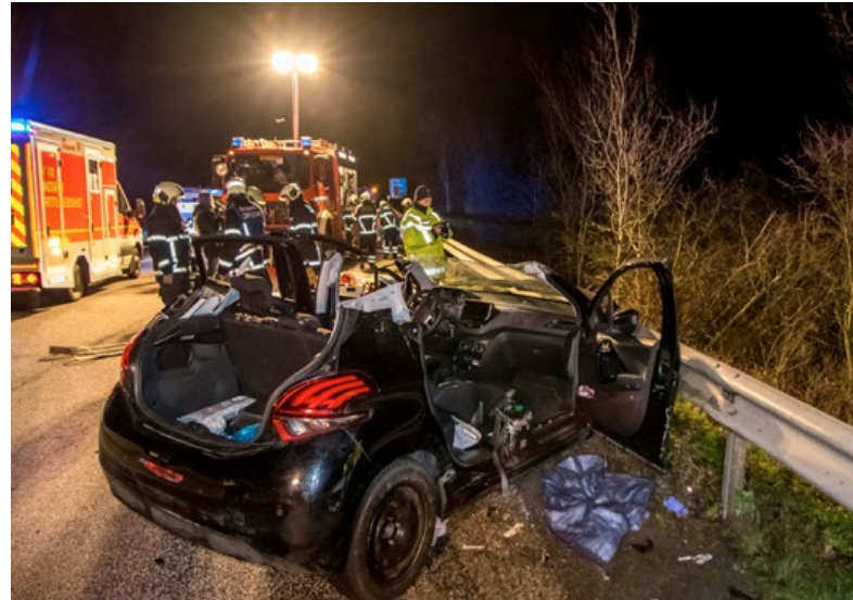
Auf der BAB1 kollidierte dieser PKW mit einem LKW.