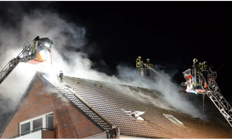
Drehleiterballett beim Feuer in Barmstedt

In der Nacht von Donnerstag auf Freitag ist in Barmstedt der Dachstuhl eines Wohn- und Geschäftshauses an der Straße Küsterkamp ausgebrannt. Mehr als 90 Einsatzkräften aus fünf freiwilligen Feuerwehren konnten das Feuer auf den Dachbereich begrenzen. Der Sachschaden dürfte dennoch im sechsstelligen Euro-Bereich liegen.