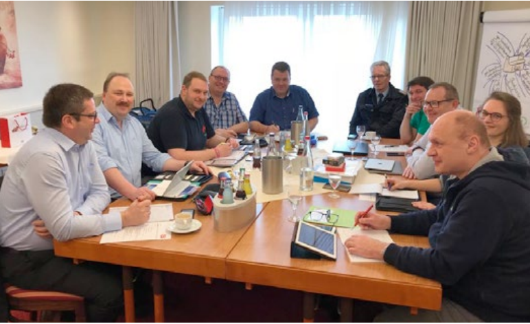
Arbeitstreffen in Isernhagen - der LFV SH war dabei.

Vom 10. bis 12. Februar 2019 tagten die Landesfeuerwehrverbände Niedersachsen, Rheinland-Pfalz, Hessen, Mecklenburg-Vorpommern und Schleswig-Holstein im niedersächsischen Isernhagen.