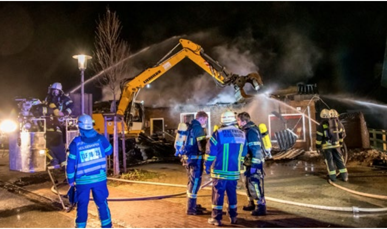
Der Ostseegrill in Großenbrode wurde ein Raub der Flammen.

In der Nacht zum 29. Januar ist im Ostseeheilbad Großenbrode an der Ostsee ein Imbiss vollständig ausgebrannt. Die Feuerwehr musste das Gebäude einreißen lassen, um den Brand zu löschen. Zwei Feuerwehrmänner wurden bei dem Einsatz leicht verletzt. Die Kripo hat die Brandermittlung noch in der Nacht aufgenommen.