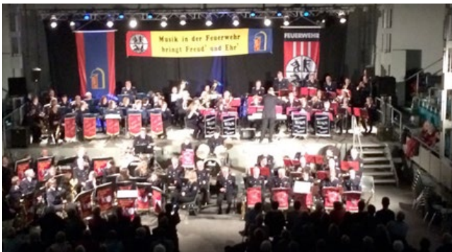
Die Konzerte im Rendsburger Bullentempel haben seit letztem Jahr ein neues Erscheinungsbild.

Diese Veranstaltung ist in Schleswig-Holstein einmalig und deshalb kommen stets auch viele Zuschauer aus anderen Kreisen Schleswig-Holsteins in den sogenannten „Bullentempel“ zum Zuhören. Nachdem die Musikzüge bisher immer unten im Kreis gesessen haben, wurde 2018 erstmals das Bühnenbild vollkommen verändert. Durch die zusätzlich eingesetzte Lichttechnik konnte so auch ein wesentlich besseres „Konzertfeeling“ erzielt werden.