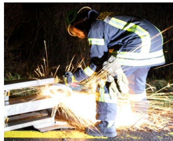
Auf der BAB7 musste die FF Nortorf Leitplanken zerteilen.