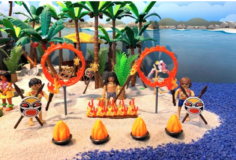
Auch ein Feuertanz auf Polynesien gehört zur Ausstellung im Feuerwehrmuseum.

PLAYMOBIL ist zurück! Die neue Ausstellung im Feuerwehrmuseum Schleswig-Holstein in Norderstedt vom 27. Februar bis 28. April widmet sich mit über 5.000 PLAYMOBIL-Figuren einem bedeutenden Stück deutscher Spielgeschichte und lässt Kinderalltag lebendig werden. Der Hamburger Künstler und Sammler Oliver Schaffer inszeniert farbenprächtige Dioramen, indem er die Grenzen zu Literatur, Film und Fantasie überschreitet. Tausende Figuren und Einzelteile lassen spektakuläre Schaulandschaften und immer neue Spielgeschichten entstehen.