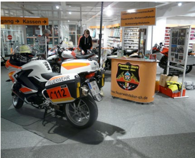
Informationsstand der Flaming Stars im Möbelhaus Kraft in Bad Segeberg.

Das Motorrad war der Blickfang auf dem Informationsstand der Feuerwehr-Motorradfahrer der Interessengemeinschaft Flaming Stars Schleswig-Holstein (FSSH). Zwischen Einbauküchen und Schränken gab Möbel Kraft diversen Händlern und Ausstellern, wie Harley Davidson, Ducati aber auch Airbag-Schutzwesten, die Möglichkeit, sich zu präsentieren.