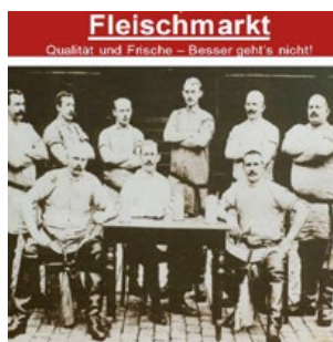
Thomsen Fleischmarkt & Bistro Edisonstraße 20, 24145 Kiel-Wellsee Tel. 0431-2008-233 www.thomsen-online.net

Inhaber des landeseinheitlichen Feuerwehr-Dienstausweises erhalten 10 % Rabatt auf das gesamte Sortiment.