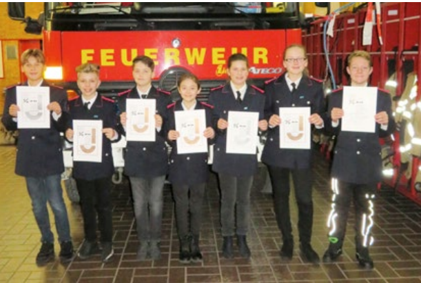
Fitte Jugendfeuerwehrmitglieder der JF Lübeck-Israelsdorf