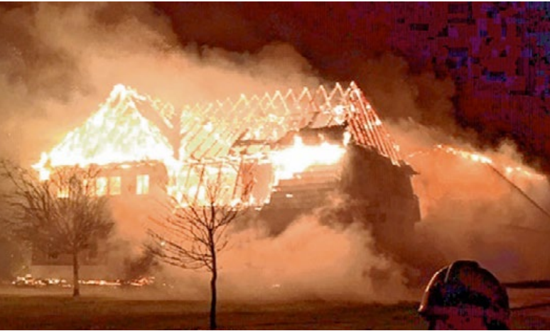
Eines der schönsten Gebäude in Haale brannte nieder