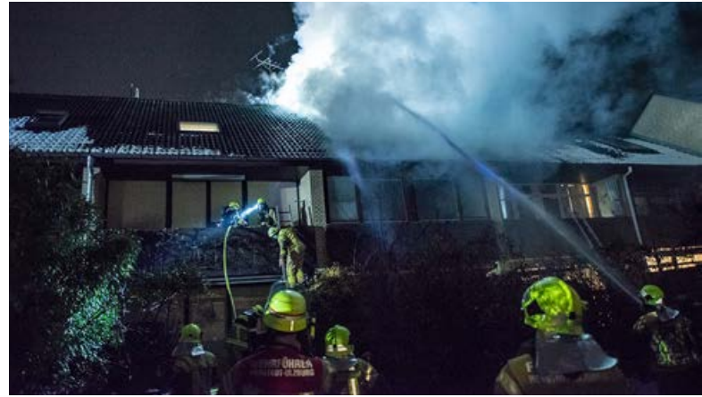
In einem Mittelreihenhaus in Henstedt-Ulzburg kam es zu einem Großbrand.

Um 00:47 Uhr waren die Nachlöscharbeiten der Feuerwehr beendet,