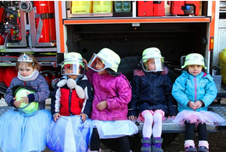
Die FF Ahrensburg machte der Kita Erlenhof ein besonderes Geschenk.

Zwei Tage nach einem Feuerwehreinsatz in der Kindertagesstätte Erlenhof hat am Freitag, 12. Februar, eine Abordnung der Freiwilligen Feuerwehr Ahrensburg die Kita-Kinder, die Fasching feierten, mit einem besonderen Geschenk überrascht.