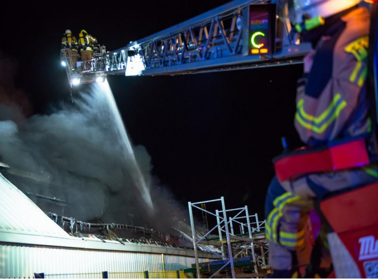
Millionenschaden entstand bei einem Brand bei einem Campingausrüster in Bad Bramstedt.

Ein Großfeuer im Gewerbegebiet Bad Bramstedt, Am Hasselt hielt am 16. März die Wehren aus Bad Bramstedt, Hitzhusen, Wiemersdorf und Lentförhden in Atem. Um 19:22 Uhr alarmierte die Rettungsleitstelle Norderstedt zunächst die FF Bad Bramstedt. In einem Betrieb, der sich auf Camping Aus- und Umbauten spezialisiert hat kam es in einer Halle mit einer Größe von ca. 20x50m zu einem Großbrand.