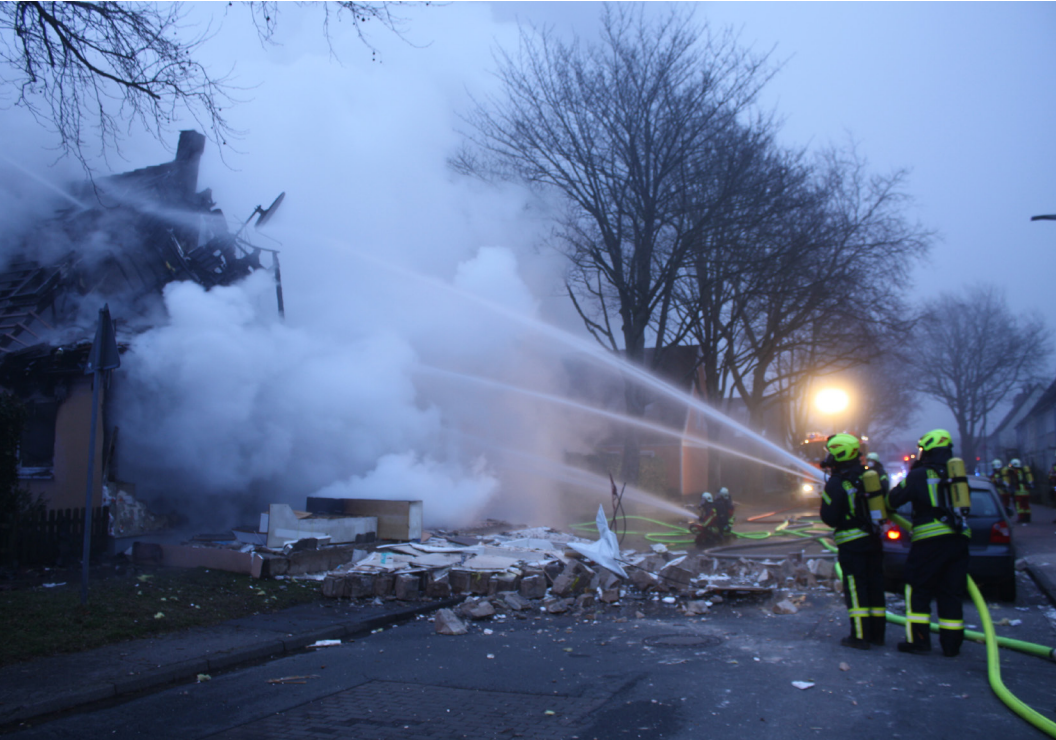
In Nortorf explodierte ein Reihenhendhaus und verwandelte das Umfeld in eine Trümmerwüste.

Am Montag, 1. März, hatte die FF Nortorf einen ihrer bislang größten Einsätze der letzten Jahre bewältigen müssen. An der Ecke Schwalbenstrasse / Marienburger Strasse kam es in den frühen Morgenstunden zu einer gewaltigen Explosion mit anschließendem ausgedehnten Folgebrand. Dabei wurde ein Reihenhendhaus komplett zerstört und das Nachbargebäude stark beschädigt. Die Giebelwand kippte in Gänze auf die Strasse und beschädigte mehrere geparkte Fahrzeuge.