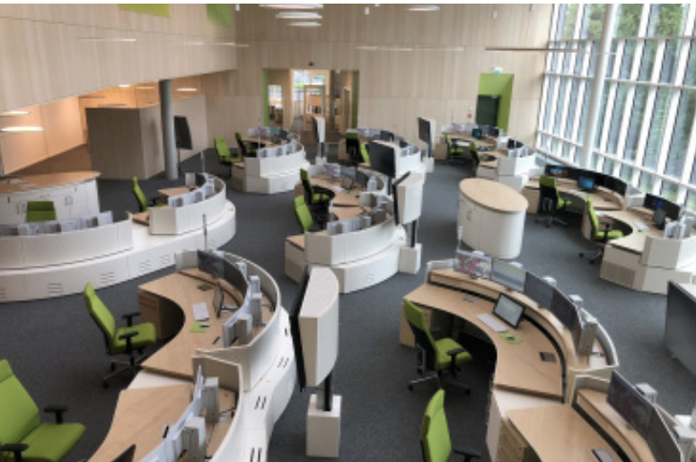
Die KRLS in Elmshorn ist nun auch für den Kreis Segeberg zuständig.

Im Dezember 2001 betraten die Kreise Dithmarschen, Steinburg und Pinneberg noch absolutes Neuland, als sie in interkommunaler Zusammenarbeit eine gemeinsame und unter der Rufnummer 112 einheitlich erreichbare Regionalleitstelle für die Feuerwehr, den Rettungsdienst und den Katastrophenschutz der Kreise Dithmarschen, Steinburg und Pinneberg einrichteten.