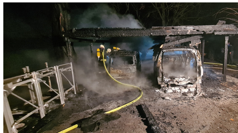
Text / Foto: Daniel Passig

Die FF Molfsee hatte den Brand schnell unter Kontrolle und konnte dann mit der FF Mielkendorf gemeinsam mit den Nachlöscharbeiten beginnen. Es waren mehrere Trupps unter Atemschutz im Einsatz. Die Trupps brachten die Gasflaschen sowie die Benzinkanister aus dem Gefahrenbereich. Die Nachlöscharbeiten liefen noch bis ca. 0:30 Uhr. Bei dem Einsatz wurde niemand verletzt. Zur Schadenshöhe und -Ursache kann derzeit keine Auskunft erteilt werden.