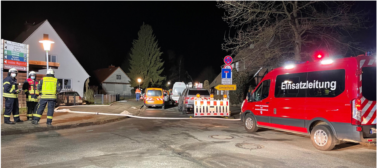
Ein flächendeckender Ausfall der Gasversorgung beschäftigte die Feuerwehr in Eutin.

Am 20. und 21. Februar sorgte ein Ausfall der Gasversorgung im Eutiner Stadtgebiet für einen längeren Einsatz von mehreren Feuerwehren und weiterer Hilfsorganisationen. Den Anfang nahm eine defekte Gasleitung in Bad Malente, bei welcher bereits die Gefahrgut-Erkundungseinheit der FF Eutin gemeinsam mit der Feuerwehr Malente im Einsatz war. Anfangs war allerdings bei weitem nicht absehbar, was dieses für den darauffolgenden Tag für Konsequenzen nach sich ziehen würde.