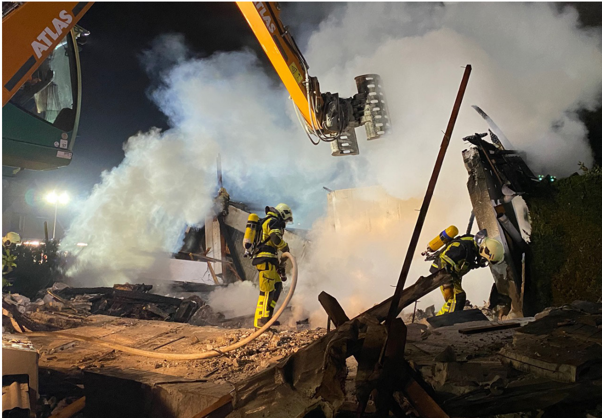
Bei einer Gasexplosion in Horst kam ein Ehepaar ums Leben.

Am 24. März erreichte die Leitstelle West mehrere Anrufe aus Horst. Die Anrufer meldeten eine Explosion und ein Feuer in einem Einfamilienhaus. Die Leitstelle alarmierte daraufhin die FF ´n Horst und Kiebitzreihe mit dem Einsatzstichwort „Feuer größer als Standard“. Schon auf der Anfahrt war ein deutlicher Feuerschein erkennbar.