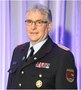
Karl-Heinz Banse ist neuer Präsident des Deutschen Feuerwehr-Verbandes

Karl-Heinz Banse ist neuer Präsident des Deutschen Feuerwehrverbandes (DFV). Der 58-Jährige aus Niedersachsen wurde im Rahmen der 67. Delegiertenversammlung mit 86 von 164 Stimmen gewählt. Die Veranstaltung hatte aufgrund der Coronapandemie verschoben werden müssen und fand nun als digitale Sitzung statt.