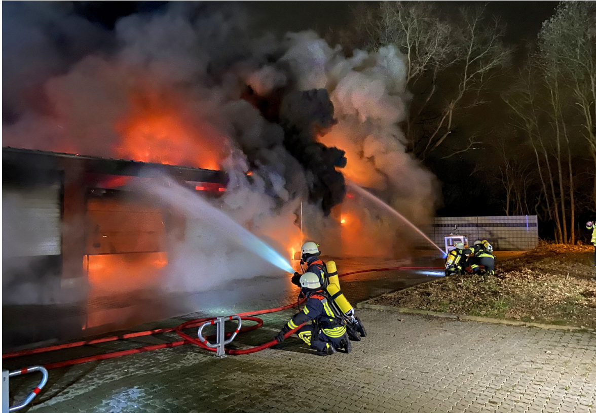
In einem Garagentrakt in Barsbüttel verbrannten auch wertvolle Fahrzeuge.

Am 22. März wurde die Feuerwehr Barsbüttel um 20.18 Uhr alarmiert. Anwohner hatten im Bereich Kiebitzhörn den Rauch und die Flammen entdeckt. Als die ersten Löschzüge kurz nach dem Alarm am Brandort eintrafen, schlugen bereits hohe Flammen aus den verschlossen Garagen-Abteilen heraus.