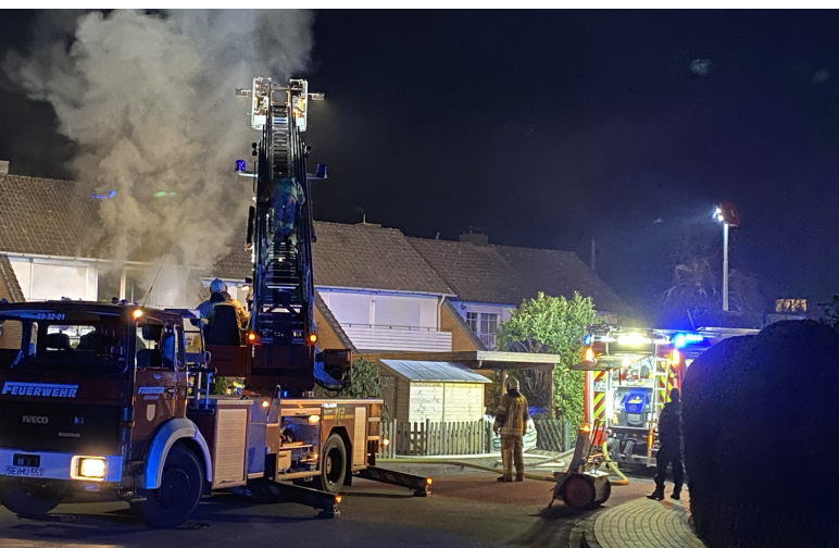
Durch schnelles Eingreifen konnte die FF Ellerau einen Totalverlust eines Reihenendhauses verhindern.

Gegen 22:33 Uhr kam es zu einem Feuer in einem Mittelreihenhaus in Ellerau. Die Bewohner des Hauses, die sich zum Zeitpunkt des Geschehens bereits zur Nachtruhe begeben hatten, bemerkten ungewöhnliche Geräusche im Haus. Beim Verlassen des Schlafzimmers konnte bereits Rauch im ersten Obergeschoss wahrgenommen werden.