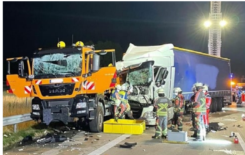
Auf der BAB7 prallte ein Sattelzug in ein Absicherungsfahrzeug.

Da bei einem der beteiligten Fahrzeuge der Dieseltank leckgeschlagen war, mussten vor Ort größere Mengen Kraftstoff aufgefangen werden. In diesem Zuge wurde auch der restliche Kraftstoff des betroffenen Fahrzeuges durch die Feuerwehr abgepumpt. Die letz-