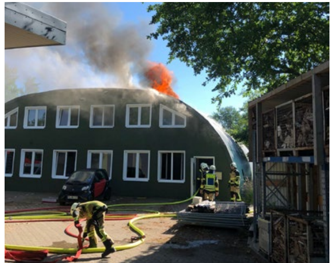
Auf einem Bauernhof in Barmstedt kam es zu einem ausgedehnten Brand.