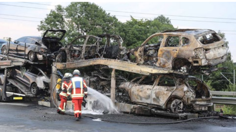
Ein Brand auf der BAB7 sorgte für ein Verkehrschaos und einen langwierigen Einsatz.

Am Samstagabend (26. Juni) gegen 19 Uhr kam es auf der A7, Fahrtrichtung Norden zwischen den Anschlussstellen Neumünster Mitte und Neumünster Nord zu einem LKW Brand. Dorthin wurde die Berufsfeuerwehr Neumünster und die Freiwillige Feuerwehr Neumünster Mitte mit dem Stichwort „Feuer 1“ alarmiert.