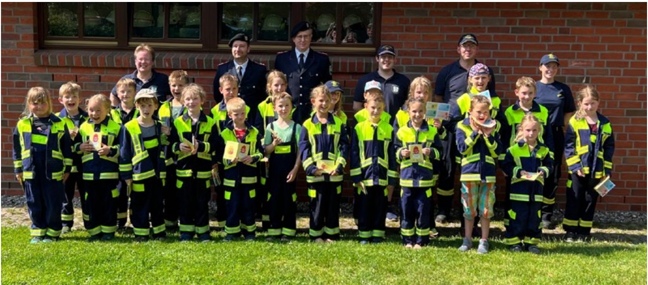
Freude über bestandene Kinderflämmchen in Padenstedt.

In diesem Jahr konnte die FF Padenstedt zum ersten Mal seit 2019 die Abnahme des Kinderflämmchens mit allen Kids beider Gruppen gemeinsam machen. Mit Feuereifer hatten die Kinder geübt, um das erste, zweite, dritte oder sogar schon vierte Feuerwehrabzeichen ihres Lebens zu erlangen - mit Erfolg.