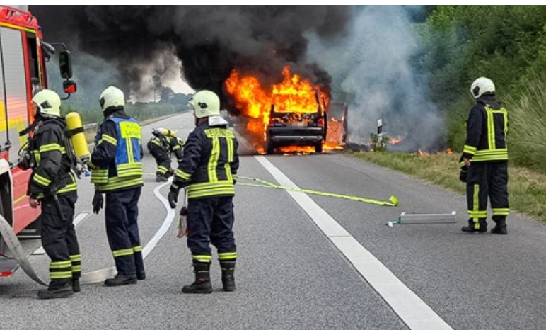
Auf der BAB1 löschte die FF Lensahn einen lichterloh brennenden VW-Bus..

Pkw-Brand am Sonntagabend (3.7.) auf der Autobahn 1 kurz hinter Lensahn in Fahrtrichtung Süden. Ein VW-Bus brannte komplett aus. Die vier Insassen konnten sich noch rechtzeitig in Sicherheit bringen. Sie blieben unverletzt. Die Autobahn wurde während der Lösch- und Bergungsmaßnahmen komplett gesperrt.