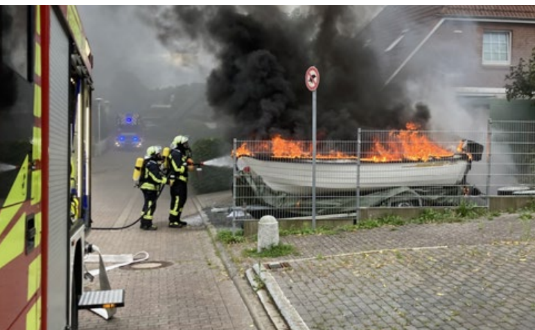
Ein kleines Motorboot brannte in Grömitz komplett aus.

Bei einem Feuer am Samstagabend (9.7.) brannte ein Motorboot komplett aus und ein VW-Bus wurde stark beschädigt. Die Feuerwehr konnte eine Ausbreitung vom Feuer auf das Wohnhaus verhindern. Die Brandursache wird nun durch die Polizei ermittelt.