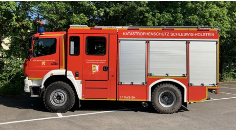
Elf weitere LF KatS für Schleswig-Holstein wurden vom Land angeschafft. (Symbolfoto).

Der Fahrzeugbestand der Katastrophenschutzeinheiten in Schleswig-Holstein wird weiter modernisiert. Das Innenministerium hat Anfang Juli 11 neue Fahrzeuge an die unteren Katastrophenschutzbehörden übergeben. Bis 2023 beschafft das Land insgesamt 52 Löschfahrzeuge des Typs „Löschgruppenfahrzeug Katastrophenschutz“ (LF KatS SH) für jeweils rund 310.000 Euro.