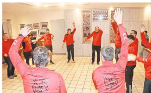
Notfalls legen die Bröthener Feuerwehrleute auch in ihrem Gruppenraum eine Sparteinheit ein.

schoben – einige sportliche Übungen mit den Feuerwehrleuten zu machen. „Alle sind glücklich, dass solche Aktivitäten nach der langen Corona-