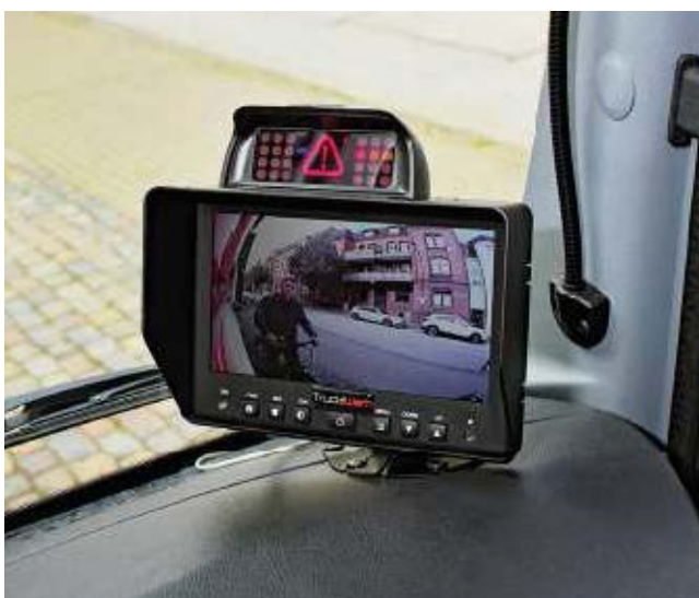
Radfahrer im toten Winkel werden auf dem Monitor angezeigt.

www.balm.bund.de/DE/Foerderprogramme/Abbiegeassistent/abbiegeassistent_node.html