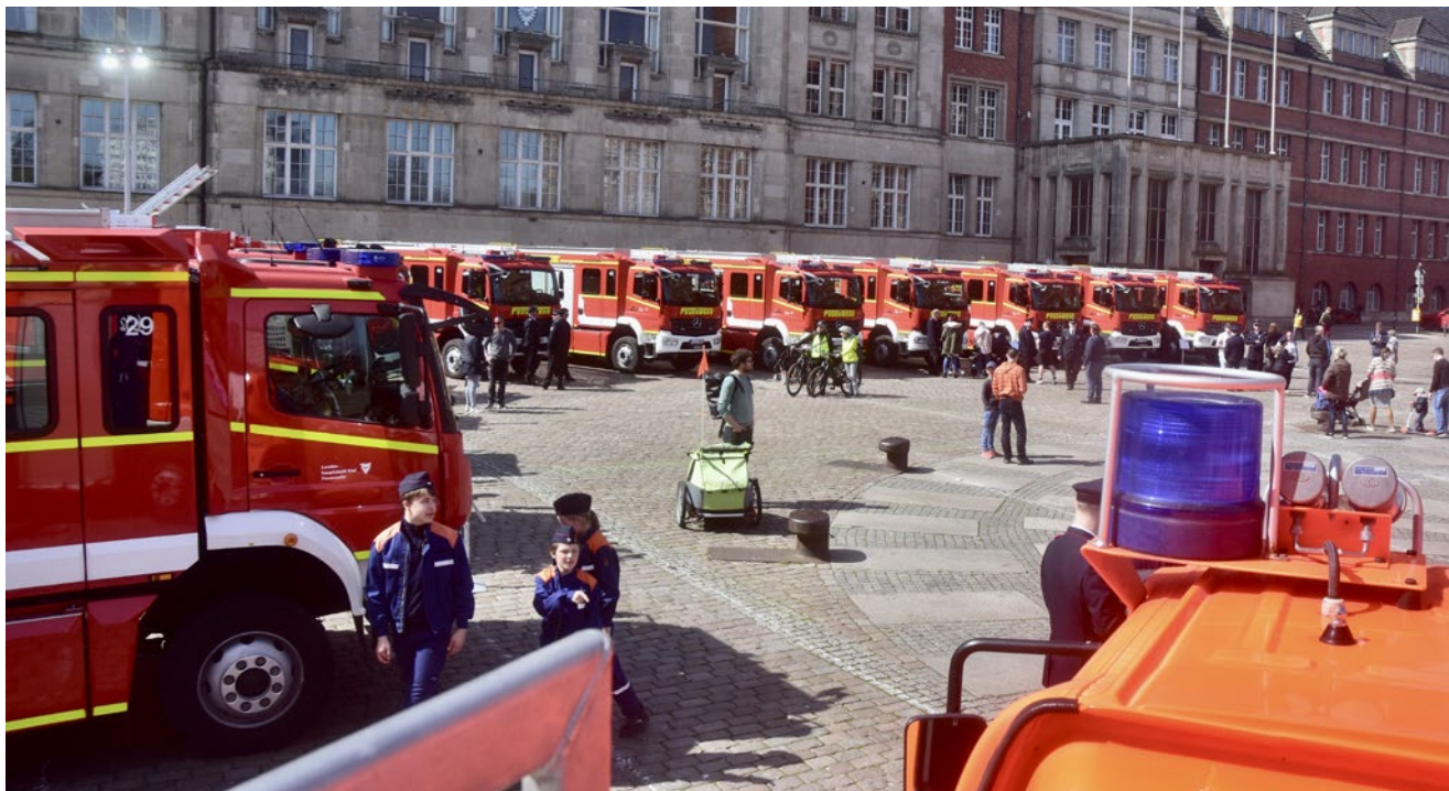
12 neue HLF 10 konnten die Freiwilligen Feuerwehren der Landeshauptstadt Kiel in Dienst stellen.

Der Brandschutz in der Landeshauptstadt hat einen großen Sprung gemacht. Erstmals in der Geschichte des Stadtfeuerwehrverbandes Kiel wurden mit einem Schlag zwölf identische Fahrzeuge des Typs HLF10 angeschafft. Bei einem Fest am Sonnabend wurden die neuen Löschfahrzeuge auf dem Rathausplatz präsentiert. Das Blasorchester der Feuerwehr Molfsee sorgte mit Manfred Peter für die passende Musik.