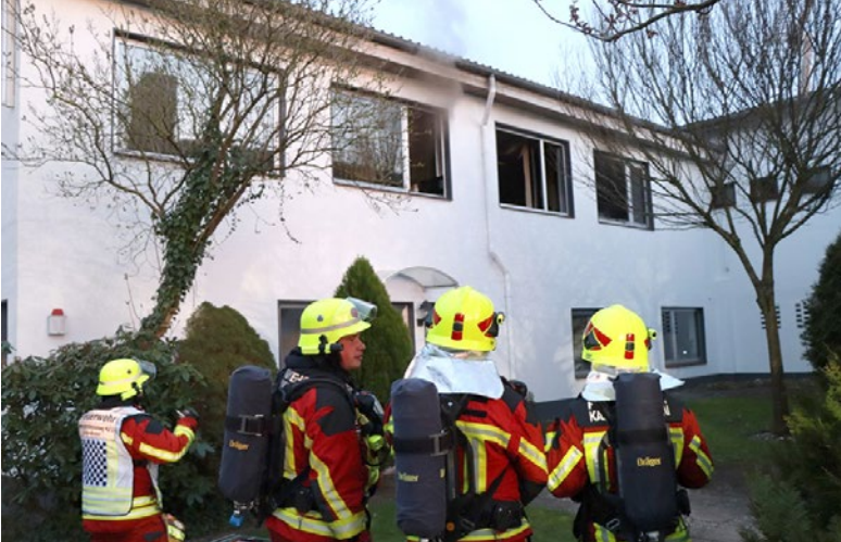
Ein brennender Kühlschrank in einem Bürogebäude in Kaltenkirchen forderte die Feuerwehr.