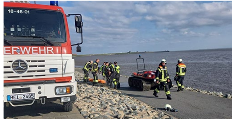
Im Watt vor Büsum befreite die Feuerwehr Mutter und Tochter.