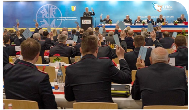
Bei Abstimmungen waren sich die Kameradinnen und Kameraden meist einig.