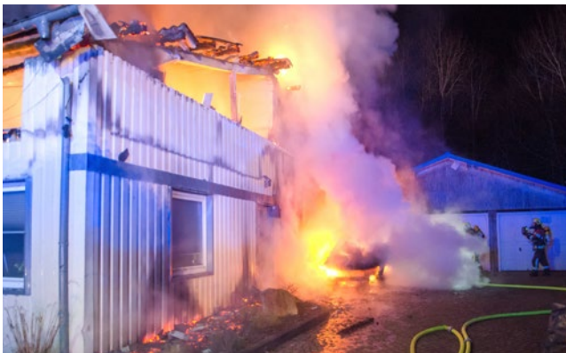
In der Büsumer Strasse in Rendsburg brannte ein Gewerbeobjekt.

In der Nacht zu Freitag (28.4.) brannte gegen 2:00 Uhr aus bisher unbekannter Ursache eine Lagerhalle in der Büsumer Straße in Rendsburg. Beim Eintreffen der Feuerwehr stand der vordere Hallenbereich bereits in Vollbrand.