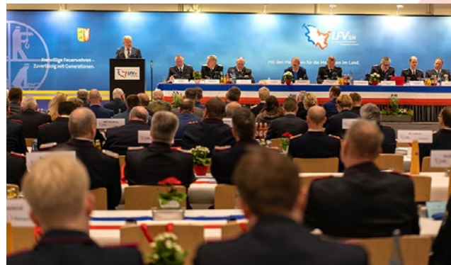
Die diesjährige Landesfeuerwehrversammlung fand in den Holstenhallen in Neumünster statt.

Die positiven Zahlen dürfen aber nicht darüber hinwegtäuschen, dass im Werben um Nachwuchs nicht nachgelassen werden darf. Denn es gebe durchaus Feuerwehren, die unter einem massiven Mangel an verfügbaren Einsatzkräften leiden. Kampagnen und Aktionen gab und gibt es daher zuhauf. Ein Beispiel konnten die Delegierten vor der Holstenhalle in Augenschein nehmen: Ein sogenanntes Infomobil, das für vielfältige öffentlichkeitswirksame Veranstaltungen von jeder Feuerwehr im Lande genutzt werden kann, wurde dort ausgestellt. Eine runde Viertelmillion Euro hat das Innenministerium Schleswig-Holstein sich diese besondere Nachwuchswerbung kosten lassen.