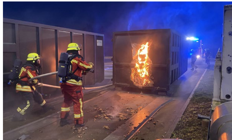
Ein Feuer in einem Müllpresscontainer beschäftigte die FF Kaltenkirchen.

Um 21:15 Uhr konnte „Feuer aus“ gemeldet werden und umfangreiche Nachlöscharbeiten begannen. Im späteren Einsatzverlauf wurde die Freiwillige Feuerwehr Norderstedt mit einem Wechselladerfahr-