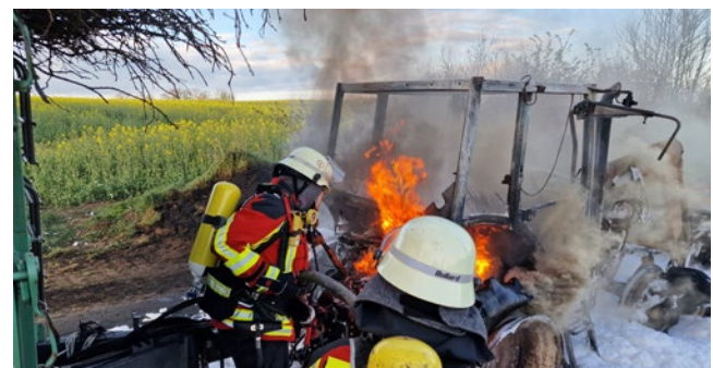
Ein Feuer beendete die Fahrt eines Traktors bei Haßmoor..