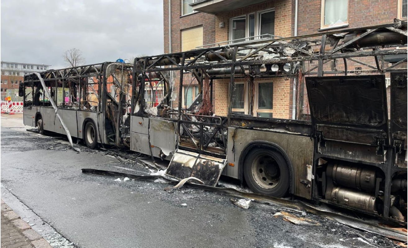
Ein brennender Gelenkbus in Pinneberg löste einen Großseinsatz aus.

Ein Gelenkbus geriet am 12. April in der Schauenburger Straße in Pinneberg in Brand. Das Feuer beschädigte zwei Wohngebäude, mehrere Personen mussten medizinisch versorgt werden - Feuerwehr und Rettungsdienst waren mit einem größeren Aufgebot vor Ort.