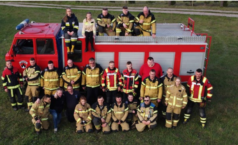
Deutsche und polnische Einsatzkräfte bei ihrer gemeinsamen Übung.

Seit 2015 treffen sich die freiwilligen Feuerwehren OSP Lotyn (Ochotnicza Straz Pozarna w Lotyniu) und Mori aus Stockelsdorf mehrmals im Jahr zu gegenseitig organisierten Trainings. Diese finden im Rahmen des EU-Programms „ERASMUS+“ statt. Beide Feuerwehren fördern die professionelle Weiterbildung ihrer aktiven Feuerwehrleute auf europäischer Ebene.