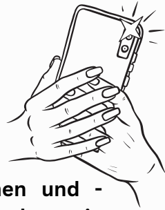
Foto machen, markieren, gewinnen! Neuer Feuerwehr-Foto-Point bei Color Line

Der Feuerwehr-Foto-Point am Color Line-Terminal ist da! Feuerwehrkameradinnen und -kameraden sind eingeladen, ihre Mini-Kreuzfahrt unvergesslich zu machen, indem sie Erinnerungsfotos am neuen Feuerwehr-Foto-Rahmen des Landesfeuerwehrverbandes schießen.