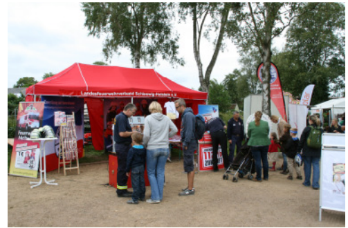
Für den Norla-Messestand des LFV SH wird noch personelle Verstärkung gesucht.

Schleswig-Holsteins größte Verbrauchermesse NORLA öffnet vom 5. bis 8. September wieder ihre Tore auf dem Messegelände in Rendsburg. Wie in den Vorjahren auch ist der Landesfeuerwehrverband Schleswig-Holstein wieder mit einem Informationsstand vertreten. Informationen rund um das „schönste Ehrenamt der Welt“, Brand- schutztipps, Gespräche mit vielen Feuerwehrkameraden, die die Messe besuchen, aber auch Spiel und Spaß beim Glücksrad, einem Geschicklichkeitsspiel und einem Wasserspiel für die Kleinen runden den Messestand der Feuerwehr ab.